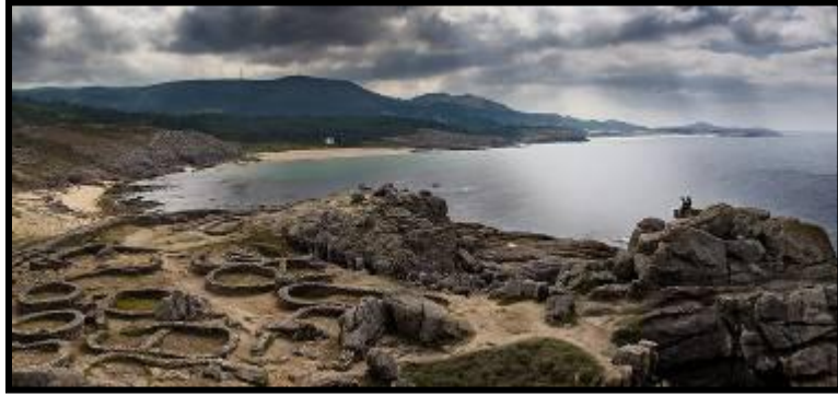
Castros de Baroña

Las ciudades de A Coruña-Ferrol y Vigo-Pontevedra, con su entorno semiurbano, reúnen más de la cuarta parte de la población de la comunidad.